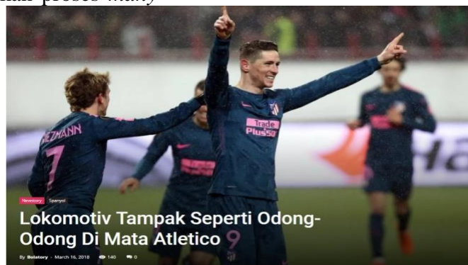
Gambar 1. Judul Berita Bolatory.com.

Berdasarkan studi pustaka dan observasi yang dilakukan peneliti, penggunaan gaya bahasa sarkasme dalam penulisan berita dalam media online bertemakan sepakbola sangat jarang ditemukan. Gaya bahasa sarkasme akan sangat terlihat bermunculan jika arah pandangan dialihkan ke media sosial lewat kehadiran Meme . Keunikan yang disusung oleh Bolatory.com memang menjadi pembeda dari kebanyakan hasil pemberitaan mengenai berita sepakbola yang dapat dikatakan masih lewat cara lama yang sudah mainstream . Bagi kebanyakan orang yang lelah dengan style pemberitaan yang cenderung kaku, Bolatory.com hadir dengan membawa angin perubahan lewat cara mereka memainkan kata-kata dan pesan lewat gaya bahasa yang sampai saat ini belum pernah disusung oleh media online lain. Contoh dari salah satu beirta yang diangkat oleh Bolatory.com dapat dilihat dari gambar di bawah ini: